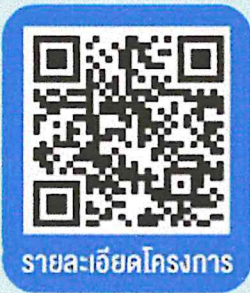
รายละเอียดโครงการ

ผู้ชนะเลิศจะได้รับรางวัลเงินสดพร้อมเกียรติบัตร