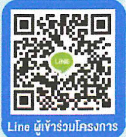
Line ผู้เข้าร่วมโครงการ