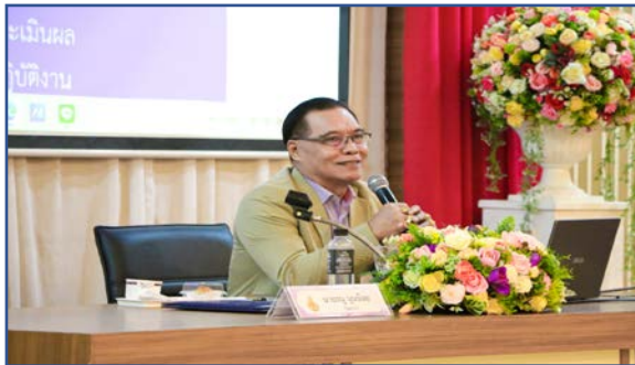
กิจกรรมที่ 1

11. ภาพถ่ายกิจกรรม ตามความเหมาะสม (อย่างน้อย 6 ภาพ)