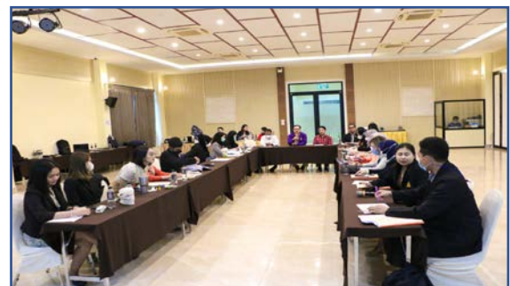
กิจกรรมที่ 2