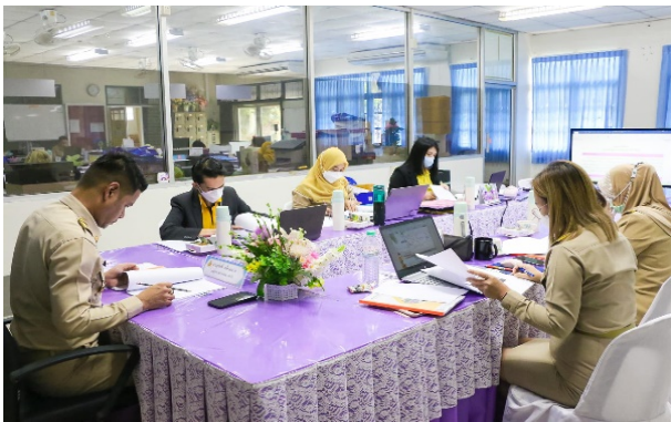
กิจกรรมที่ 1

11. ภาพถ่ายกิจกรรม ตามความเหมาะสม (อย่างน้อย 6 ภาพ)