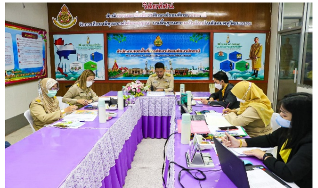
กิจกรรมที่ 2