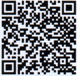
QR Code ใบสมัคร