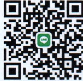
QR Code กลุ่มไลน์เพื่อส่งผลงาน