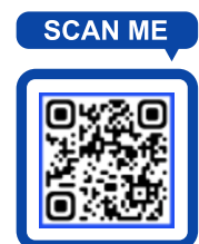
<KOICA CIAT website>