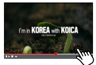
<KOICA SP Introduction Video>