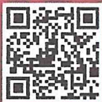
เพลงลูกกรุง

รับสมัครตั้งแต่วันที่ 15 พ.ค. – 15 ก.ค.69