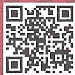
เพลงลูกทุ่ง