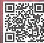
เพลงไทยร่วมสมัย